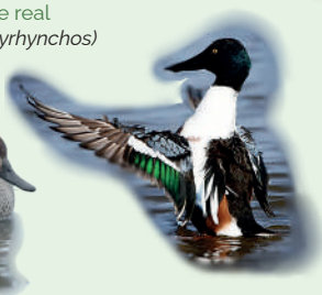
Cuchara ( Spatula clypeata )