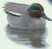
Cerceta común ( Anas crecca )