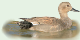
Ánade friso ( Anas strepera )