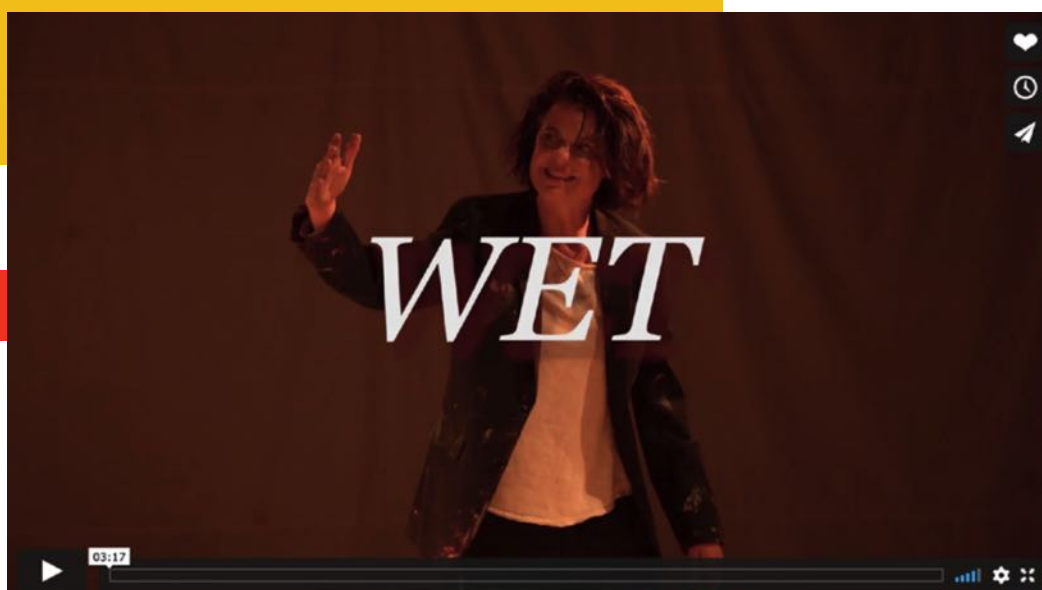
P R O M O T R A I L E R