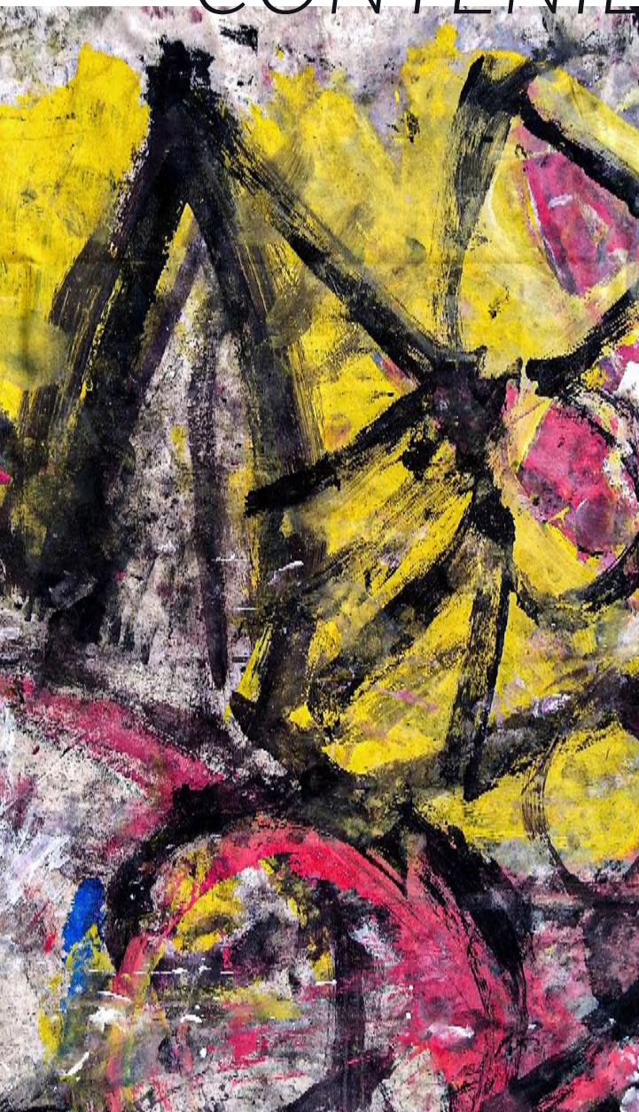
Pintura creada durante 20 performance de Wet en Fringe Festival. Edinburgo.(3x6m)