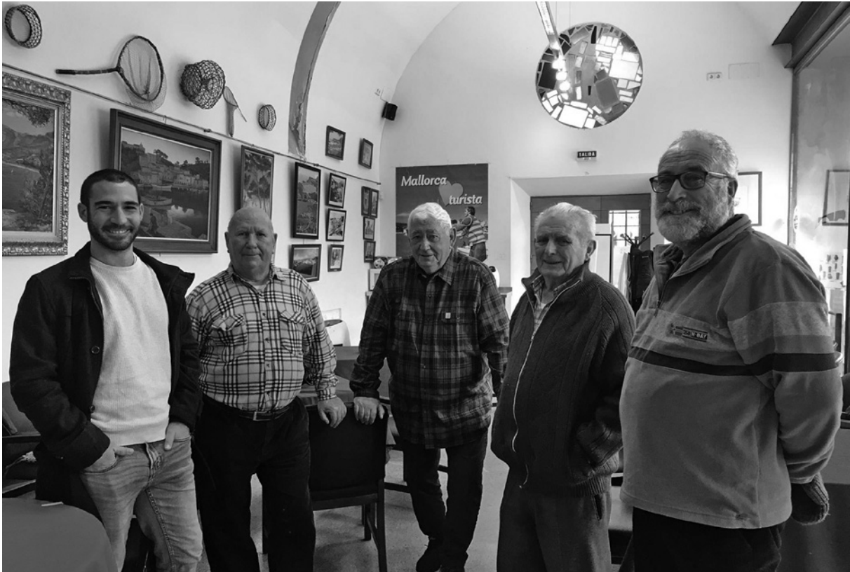
Imatge 8. Diferents testimonis que van participar en la recerca emmarcada dins el projecte "La remor de la memòria"